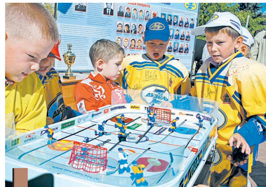
...почувствовать себя хоккеистами...

В следующем выпуске газеты от 11 сентября мы расскажем о спортивных учреждениях, действующих за пределами областного центра, – от Кузнецкого до Мокшанского района. Подготовил Артем КРАСНОВ, фото Владимира Гришина.