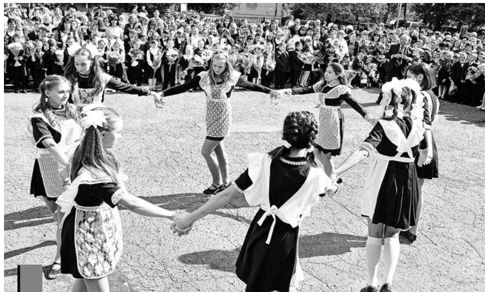
Советская форма пользуется популярностью у современных учениц.