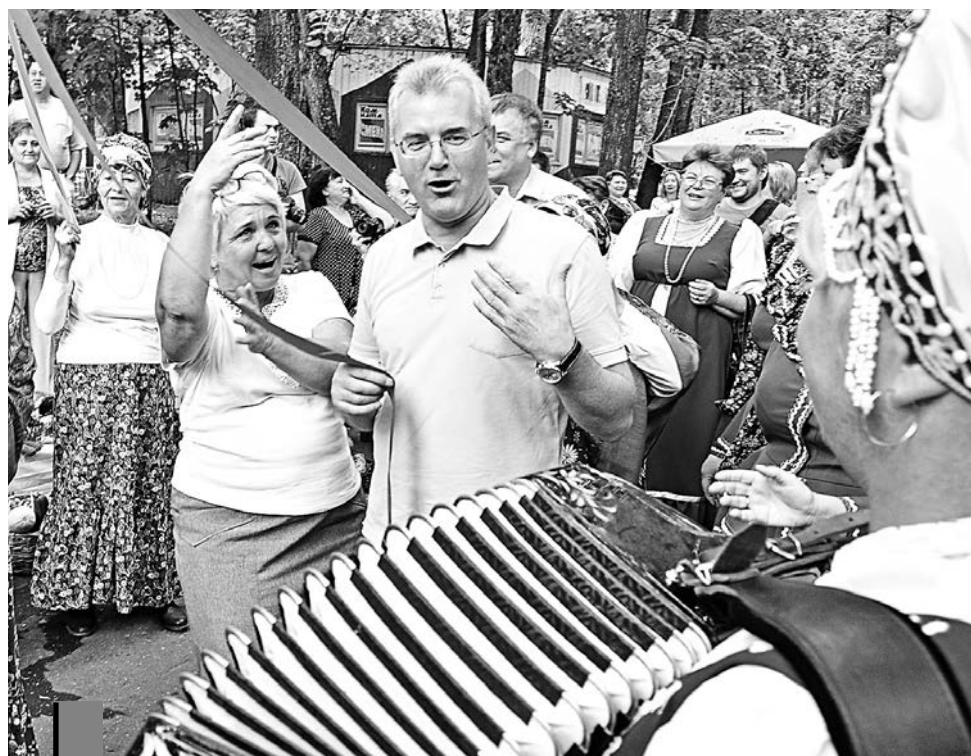
В такой день как не спеть под гармошку?