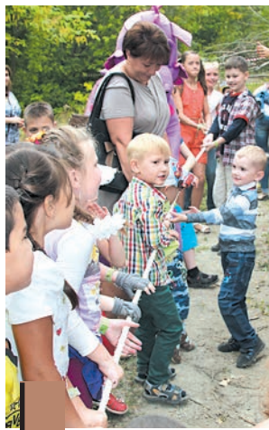
Мистер Вселенная уступил победу детям.