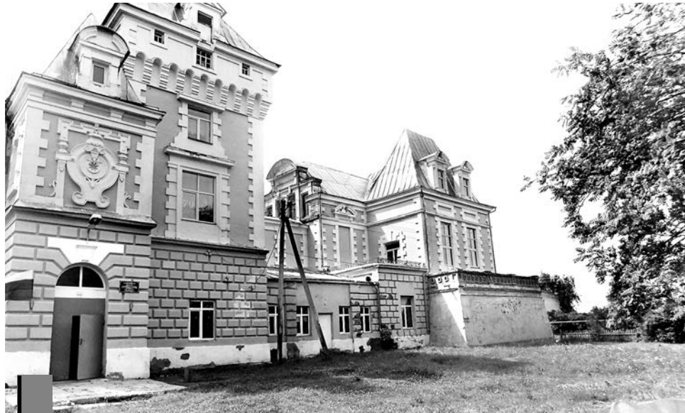
В бывшей барской усадьбе теперь школа.