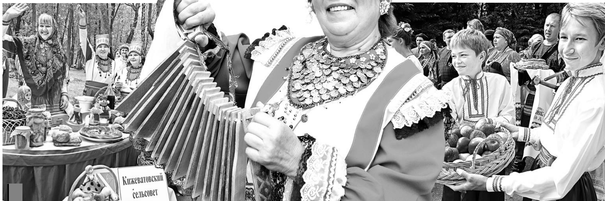
Гостей праздника тепло встречали и вкусно угощали.