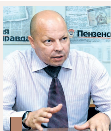
Глава облспорткомитета Артур Пантелеев.

19 сентября на Фонтанной площади в Пензе пройдет традиционная презентация спортивных школ. «Земляки» при поддержке областного спорткомитета заранее знакомят своих читателей с их предложениями