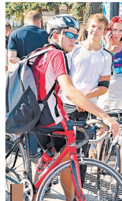
...прокатиться на гоночном велосипеде...