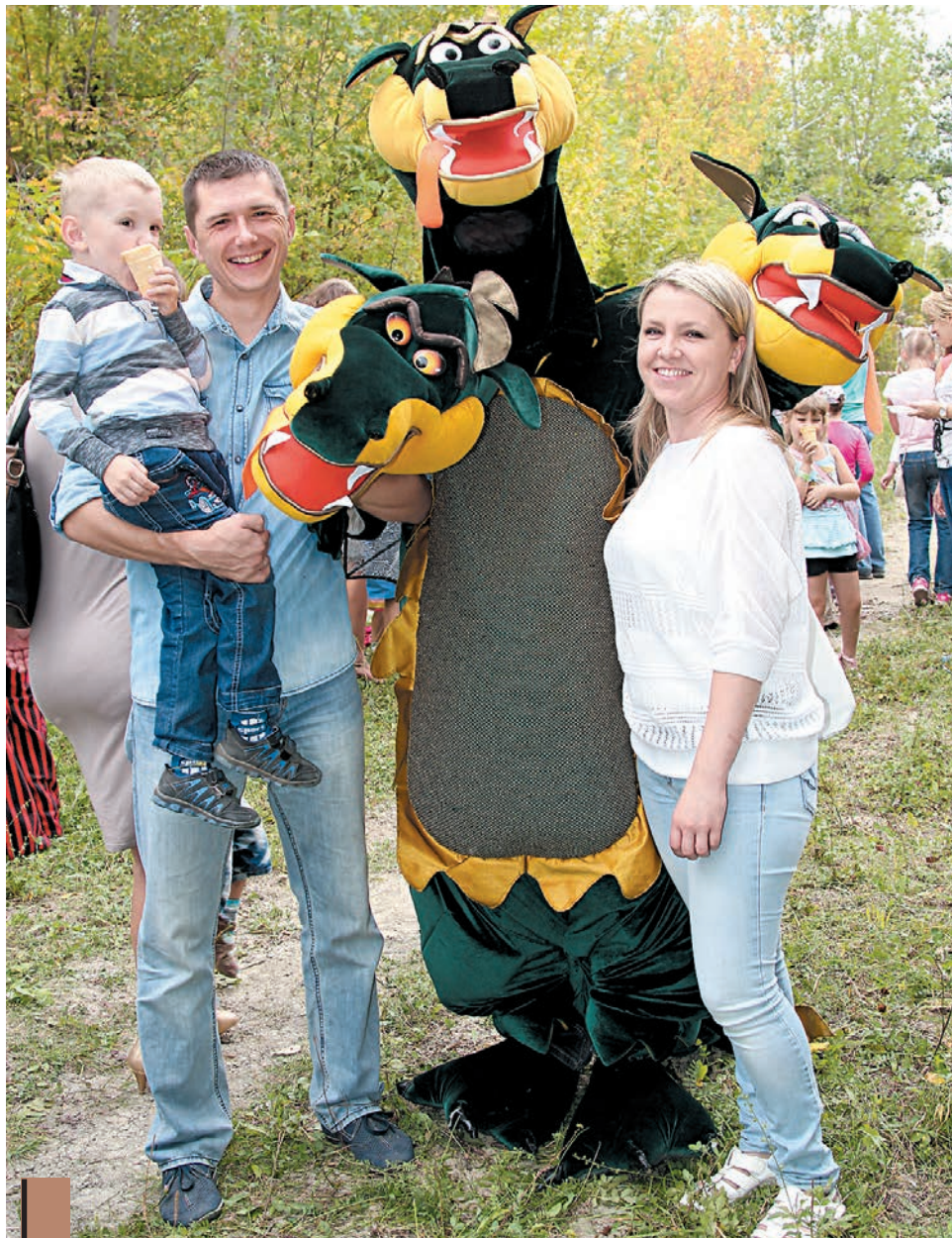
На праздник приходили целыми семьями.