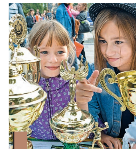
...прикоснуться к кубкам и медалям. Когда никто не видит, можно попробовать их прикусить, как настоящий спортсмен.