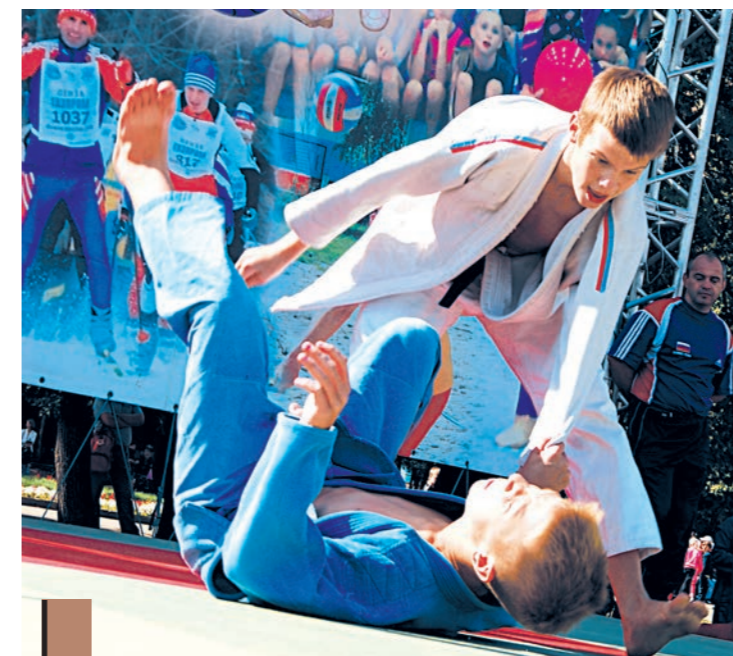
...посмотреть на каратистов...