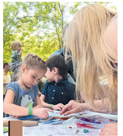
Учеников у мастериц было столько, что едва хватало красок.