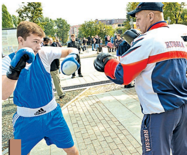
...побоксировать с профессиональным тренером...