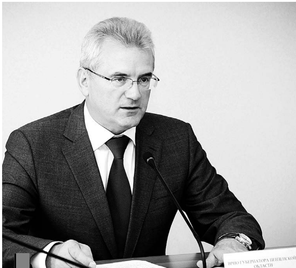
Вр.и.о. губернатора Иван Белозерцев.