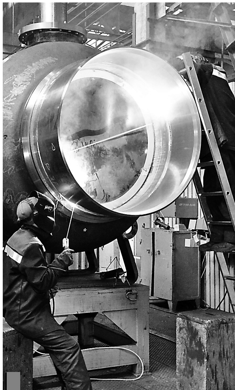
На крупных производствах всегда особые требования к условиям труда.

а) Федеральной службой по труду и занятости в отношении работников организаций, входящих в группы компаний (корпорации, холдинги и иные объеди-