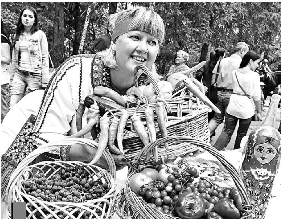
Дары лета на любой вкус.