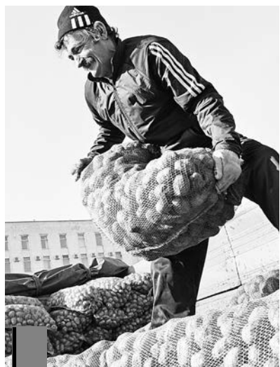
Все на ярмарку!

5 и 6 сентября, пл. Ленина, 8.00 – 15.00.