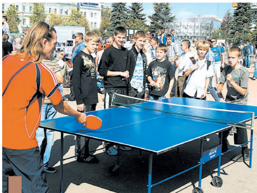
...попробовать себя в настольном теннисе...