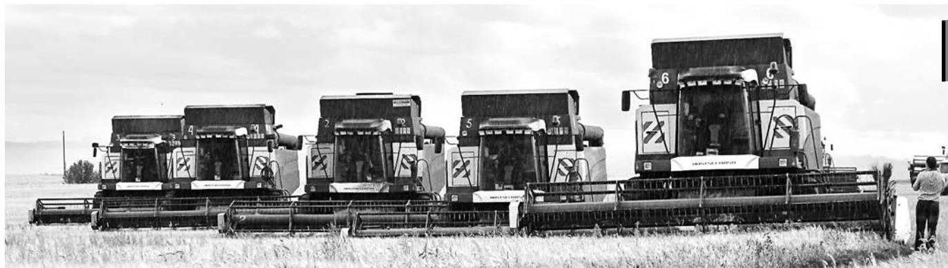
На финише: в области убрано порядка 90% зерновых.