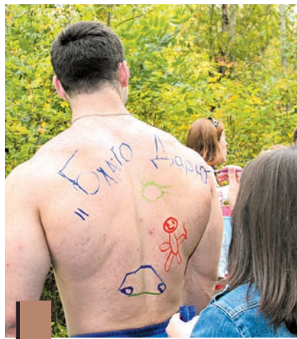
Акварель на мышцах культуристов – редкая техника рисования.