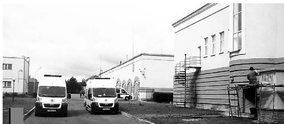
Поликлиника ждет первых посетителей.

Татьяна ВЕСЕЛОВА, фото health.pnzreg.ru.