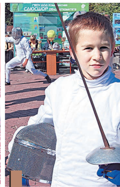
На презентации можно начать учиться фехтованию...